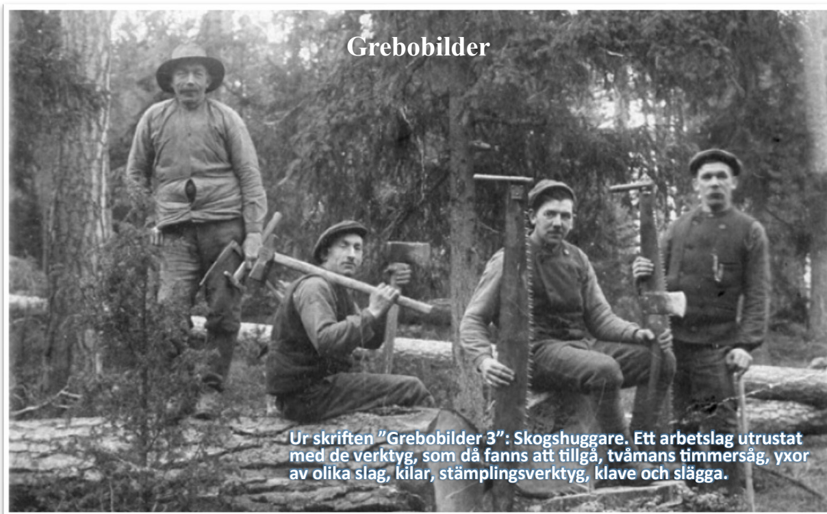
Ur skriften "Grebobilder 3": Skoghuggare. Ett arbetslag utrustat med de verktyg, som då fanns att tillgå, tvåmans timmersåg, yxor av olika slag, kilar, stämplingsverktyg, klave och slägga.

Fotografering har varit mitt stora intresse sedan tonåren, men 1973 hände något som fick betydelse för framtiden. En bekant, Gunnar Melefors, kom med en bunt gamla gulnade fotografier och undrade vad man kunde göra med dem. Jag hade precis fått en systemkamera i födelsedagspresent, och en fotoexpert från Linköping, Thore Hagald, lånade mig ett makroobjektiv och några filter, som jag kunde använda för att göra reprofoton.