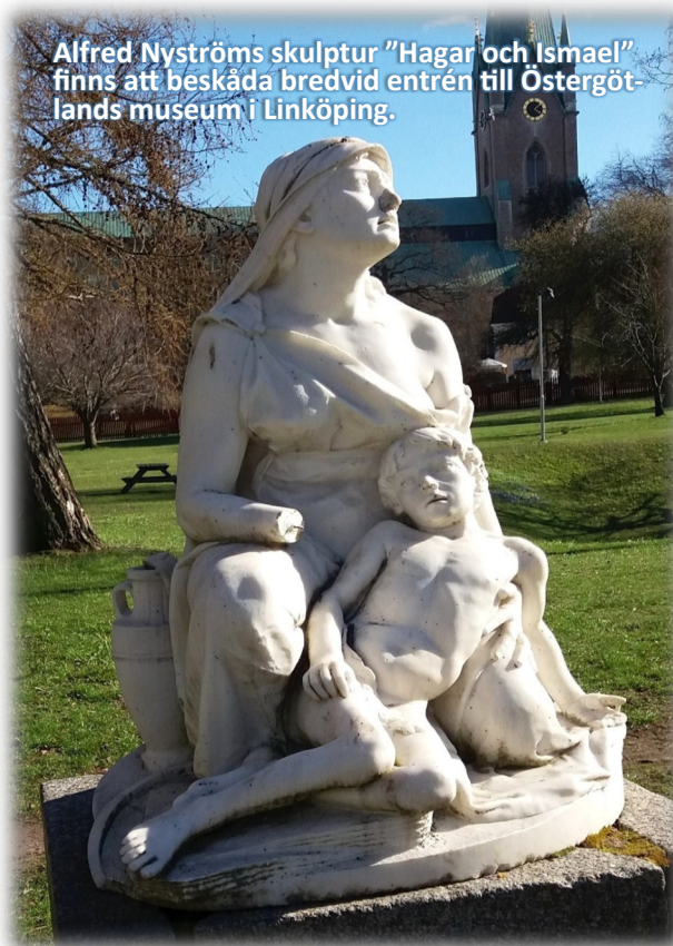
Alfred Nyströms skulptur ”Hagar och Ismael” finns att beskåda bredvid entrén till Östergötlands museum i Linköping.