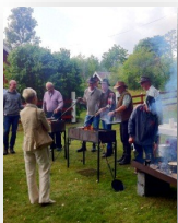
Kolbullar tillagas vid Nykils Hembygdsförenings 40-årsjubileum.